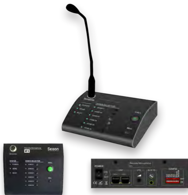
MP-6 : PUPITRE MICROPHONE 6 ZONES COMPATIBLE POUR LA SÉRIE D'AMPLIFICATEURS AME