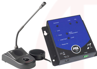
PACK DUO / PDA103R