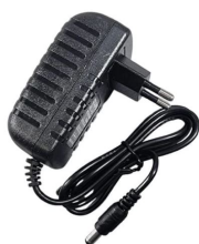
Alimentation DC 19V 16A

Kit amplificateur 30W bluetooth avec 2 haut-parleurs. .... LA-30KIT-HP (code 02674)