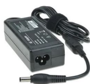
Alimentation DC 19V 16A

Module amplificateur bluetooth..... LA-60AMP (code 02670)